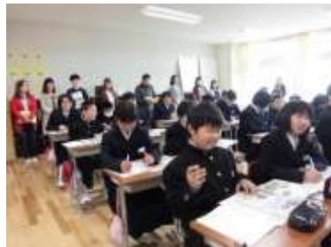
少し大人になった(?)7年生