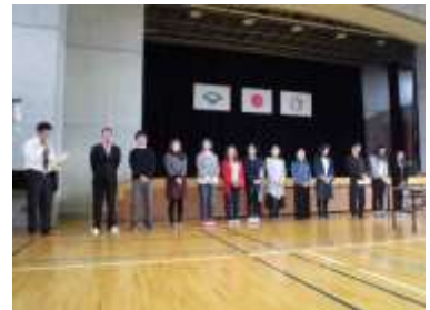
総会での新役員紹介