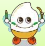
学園マスコット “いなっ子”