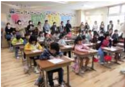
初めての授業参観（緊張？）の1年生