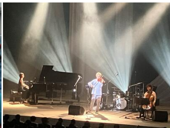
芸術鑑賞教室の様子