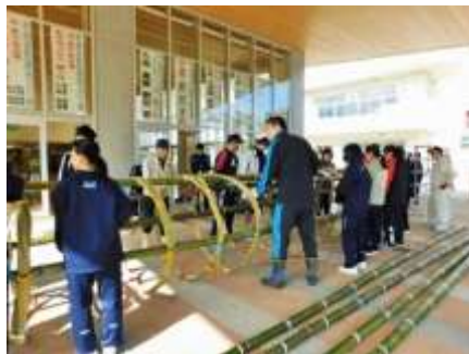
次第に松明になってきます