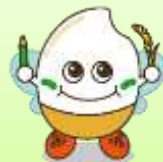
学園マスコット “いなっ子”