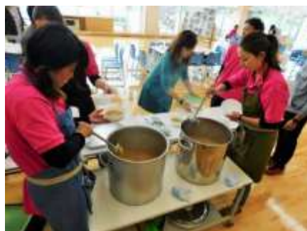
今年も温かい豚汁がふるまわれました