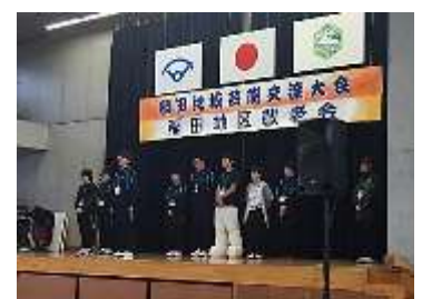
ジュニアボランティアの皆さん

会の最後には、一人一人がお年寄りにお祝いの言葉を堂々と述べて、大きな拍手をいただきました。これからも地域のために活躍できる子ども達を育成していきたいと思ひます。