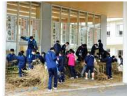
松明本体にたくさんの茅詰め