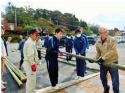
協力会の皆さんと一緒に