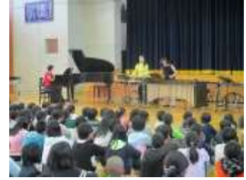
楽しかった音楽鑑賞教室

マレット・ガーデンの皆さんは、東京芸術大学出身のパーカッショニスト・ピアニストのグループで、私たちが知っているさまざまなジャンルの音楽を楽しく披露してくださいました。音楽鑑賞会の後半には児童生徒が参加するコーナーがあり、みんなでリズムにのって歌ったり、ボディ・パーカッションで盛り上がりたりするなど楽しい時間を過ごすことができました。