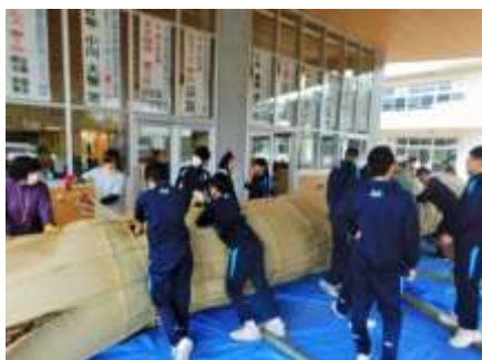
畳表で竹組を巻きます