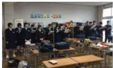
朝の9年生の合唱練習