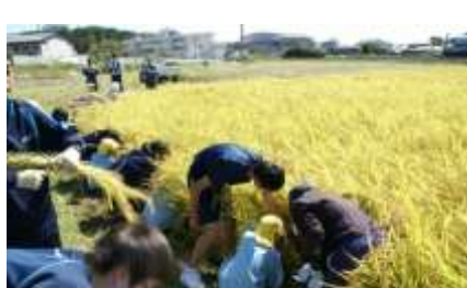
園児のお世話をする8年生