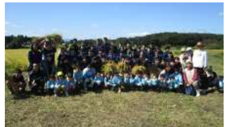
刈取り後の記念撮影