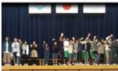
6年生の練習のようす