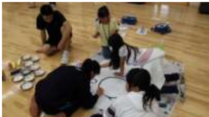
小・中学生一緒に準備