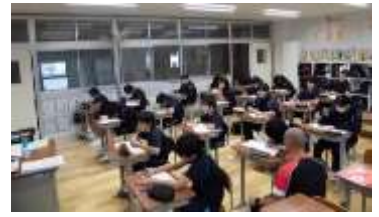
5級の英検チャレンジの様子

今後も、稲田学園では学力の向上をめざして、英語検定などの各種検定の受検を奨励していきます。