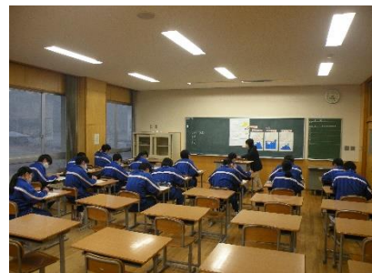
(社会科の補講より)