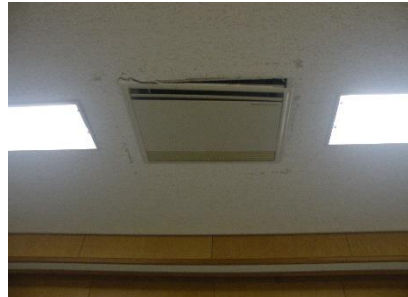
（コンピュータ室の天井より）