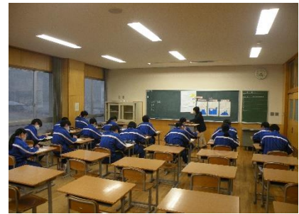
(社会科の補講より)