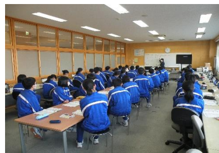
（真剣な態度でお話を聴く3年生）

5日（火）に3年生の生徒を対象に租税教室が行われました。講師に●●●会計事務所税理士の●●●●●様をお迎えし、ご講話をいただきました。資料「私たちの暮らしと税」を活用しながら、税金はなぜ必要か・税金の種類・税金の仕組みなどについて詳しく学習をしました。生徒たちは終始、真剣な眼差しで話を聴いており、今まで知らなかった税について理解を深めることができました。税金にもいろいろな種類があり、結構な金額を年間で支払っていることへの嬉しさ半分・苦しさ半分を感じました。