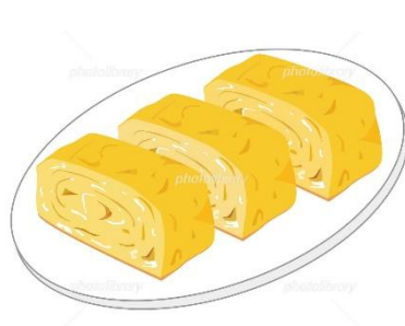
（思い出の厚焼き玉子より）