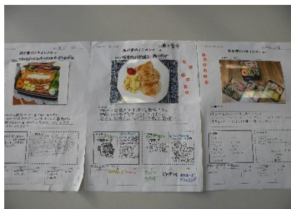
（1年1組のメニューより）

余談になりますが、私が若い頃、須賀川市内の中学校に勤務し担任していた時、弁当の日はいつも女子生徒のお母さんが作った甘い厚焼き玉子が大好きで、よく生徒とおかずを交換して食べていました。そのうち、私専用の厚焼き玉子が準備されるようになり、今でもその味は忘れられません。