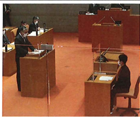
(模擬議会の様子：市長との質疑応答)