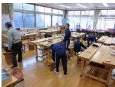
技術の授業：木材加工