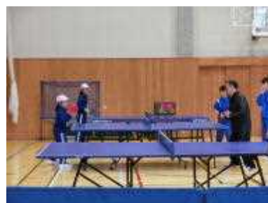
部活動の様子：卓球部