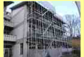
▲ 太陽光パネル設置工事も進行中!

※ 旗りゅう(旗)文字...国際信号旗とも言い、海上において船舶間での通信に利用される世界共通の旗文字です。未来の広がり。そこを揚々と航行する生徒が乗った船をイメージできますね。