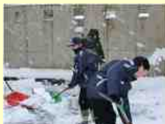
職員・生徒総出の雪かき

暖冬に油断していたらついに猛威をふるった冬将軍。今年初の大雪でしたが、生徒たちは登校後、すぐに雪かきをしてくれました。誰に言われずともこういう進んで行うことができる生徒に育ってくれていることがとてもうれしいです。(〆)