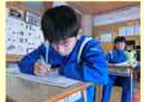
テストにのぞむ1年生

気になったのは、「学習の仕方」。県の過結果と比較して低いのが、「テストで間違えたところをあとでやり直す」「分からないときは辞書を引く」の結果は低い値となっています。今後は、授業で理解したことを確実に定着させ、使いこなせるようにするために復習に力を入れること、問題に多く取り組み、間違いをそのままにせず分かるまで何度も解いてみる、といった学習を取り入れていくことが必要ですね。