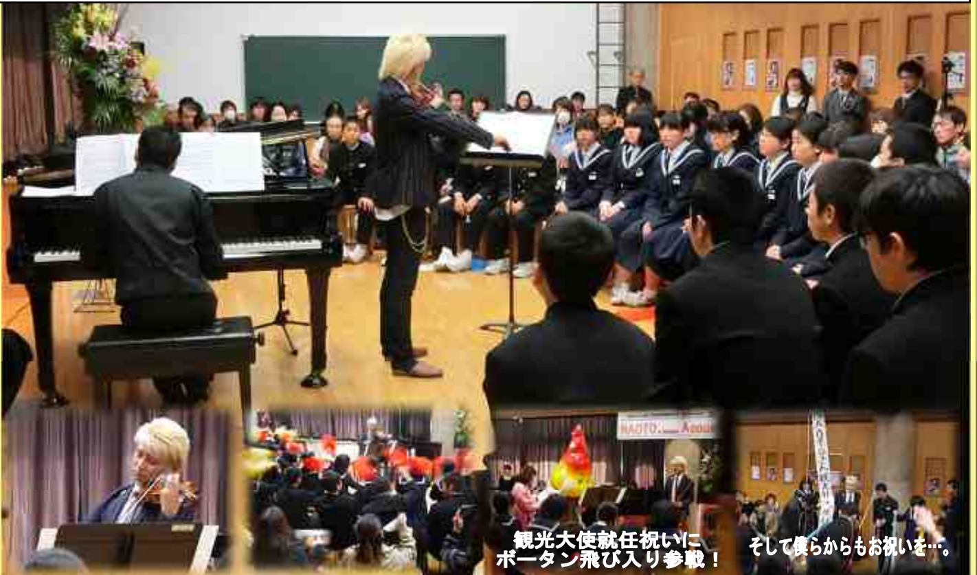
観光大使就任祝いにポータン飛び入り参戦! そして僕らからもお祝いを…。

松明あかしの皆さんのエールは暫く耳から離れません。あれだけのパワーをもっている皆さんです。何事にも挑戦し続けたいと道は開けるはず。観光大使になったこともあり、須賀川市には強い思いを持っています。また必ず小塩江中におじゃまします。ちなみに…野球は日本ハムファイターズの熱烈応援団、卓球は町内会優勝のぼくです(笑)。今度来たときは、野球や卓球の試合を皆さんと一緒にしたいと思います。また会いましょう!