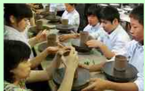
会津慶山焼 焼きものづくり

5月19日(火) 1・2年生が志津若松市方面へ学習旅行に行ってきました。全員で会津慶山焼の焼きものづくり体験を終えた後、小グループで市内を班別自由研修。日清館のような歴史的建造物を見て回ったり七日町通りの店舗を思い思いに回り買い物をして回ったりと楽しい時間を子どもは過ごしてきました。最後はみんなで鶴ヶ城へ！学校を離れ、グループで一日を過ごせよい思い出ができました。旅行してきたことは一人一人が思い思いにまとめました。教室等に掲示しましたので学校においでの際、ぜひご覧ください。