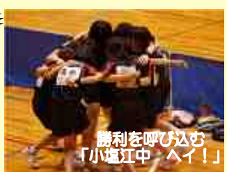
勝利を呼び込む「小塩江中、へい！」