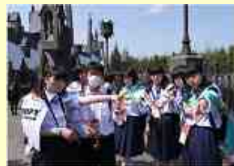
▲ ハリーポッターエリアで