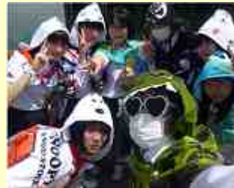
▲ なんだこの集団は・・・