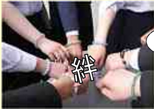
▲ そして輝く 小塩江中 ハイ！

この日は班別行動。私たちの班はまず始めに京都御所にいきました。ここで池田先生から出された宿題を…。外国人と挨拶をして写真を撮るといふミッションにチャレンジ！かなり緊張しましたが自分がしゃべった英語が通じたのがうれしかったです。二条城を見学した後はお昼！京都で食べるカツサンド！思ったよりでかく、京都の食べ物はいいなと思いました。体験場所の「香の都」では、数珠の政策に挑戦。私は、黄緑色の玉を選んで作りました。ひもに通すのは難しかったけどうまく作ることができ、一生の記念になりました。夕方、集合場所の京都駅に無事到着。迷わなくてよかったです(^v)