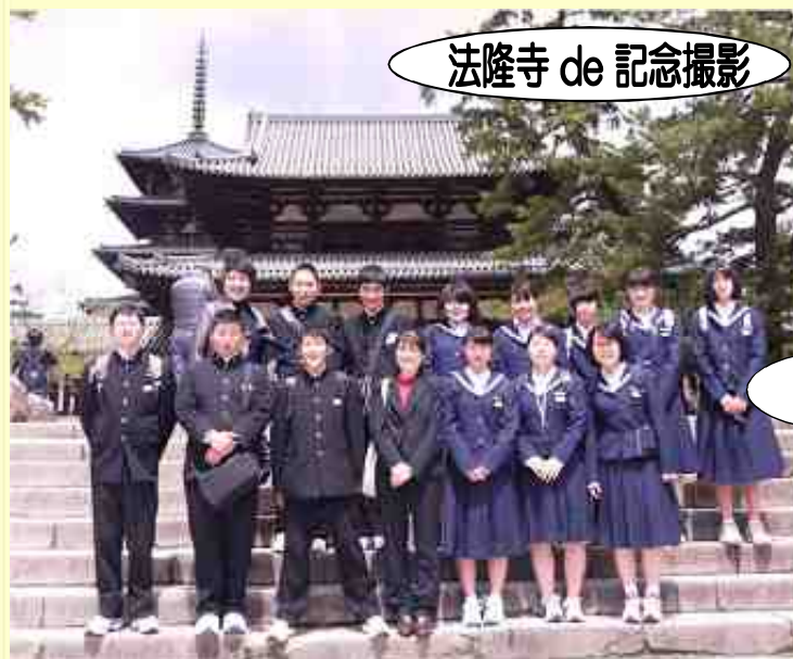
法隆寺 de 記念撮影

奈良公園ではあの有名な奈良の大仏を見学。奈良公園に入ると...鹿! 鹿! 鹿! 大仏の大きさに圧倒されるも、やっぱり鹿たちが気になり、最後に「鹿せんべい」をあげてきました。鹿せんべいを買ってあげようとしたその時、鹿が何頭も寄ってきました。鹿せんべいを包んでいた紙も食べてしまいました。中には東大寺のチケットを食べられてしまった人も...。みなさん何でも食べます。間違ってもお礼はあげないようにしてください。笑