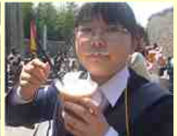
▲ USJのアイスはおいしいぞ