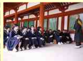
▲ 薬師寺では和尚さんにありがとうの話を