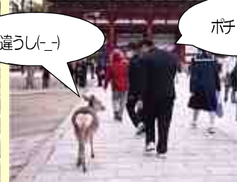
▲ なぜきみはシカと友達になれるのか?