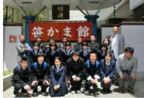
△みんなでハイポーズ!!

2年生。しっかり1年生をリードして地下鉄に乗ったり、歩いたりして最終目的地仙台市科学館をめざしました。生徒たちは班活動を中心に、集団行動を通して、学級や学年間の相互理解を深めることができました。