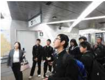
△地下鉄で迷いながら切符購入

天候に恵まれ、1・2年生は歴史や文化を探る学習の旅に仙台へ行ってきました。途中交通渋滞に巻き込まれましたが、大した遅れることもなく鐘崎ささかま館で笹かま作りを体験した後、班別自主研修を行いました。今年も学年の枠を超えて班を作り取り組みました。もちろん班長は