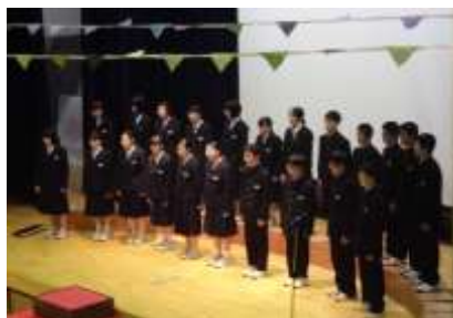
秋華祭 合唱コンクール