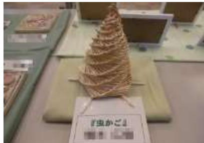
麦わらで造った「虫かご」