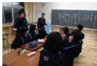
実行委員会の様子