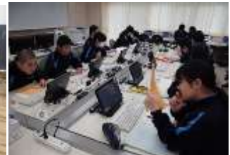
タブレットを使った事前学習