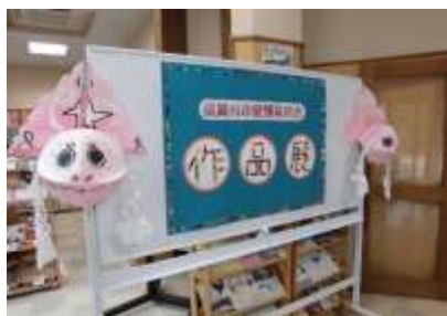
愛護育成会作品展

本校からもわかくさ学級に在籍している〇〇〇〇くんの工作と書道の作品を出品しました。下の写真をご覧くださいもお分かりのように、その出来栄はすばらしいものでした。