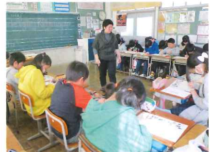
中学校教員による小6外国語活動