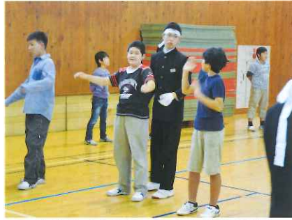
中学校応援団による小学生指導