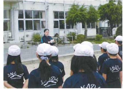
生徒会長による小学鼓笛隊激励