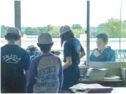
合同ボランティア活動