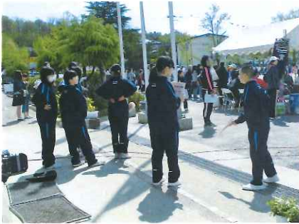
小学校運動会ボランティア活動