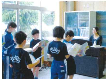
中学校教員による小5音楽指導