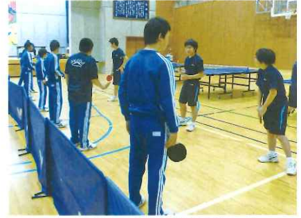
小学生の部活動体験