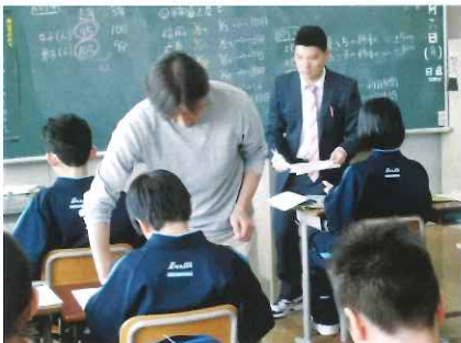
中1年数学への小教員のT2指導