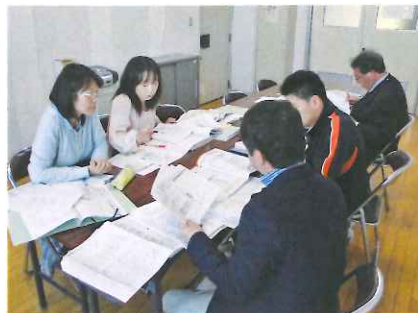
小中教職員による各部会(現職)