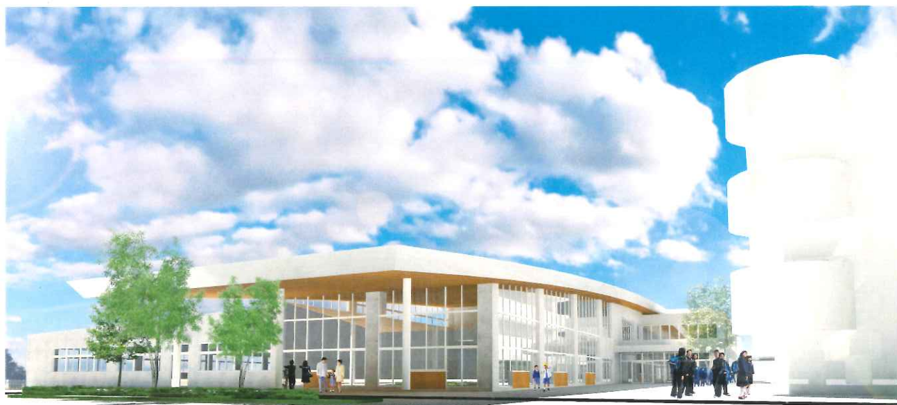
新校舎完成予想図（平成30年4月）