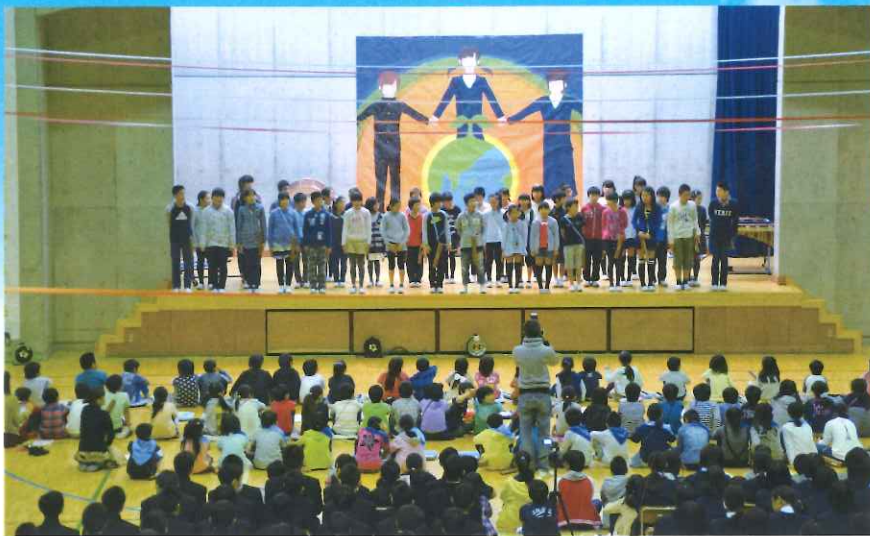
小中合同文化祭（秋華祭）