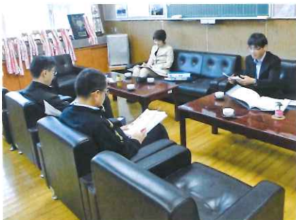
小中一貫教育運営部会