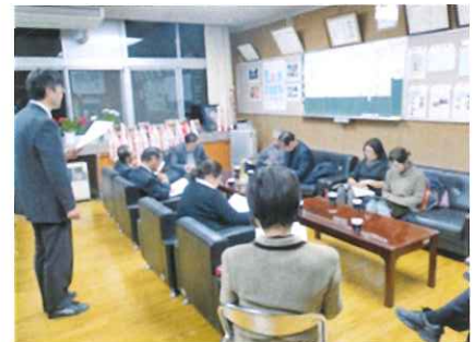
小中一貫教育地域運営協議会