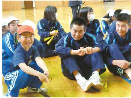
いなだっ子集会活動