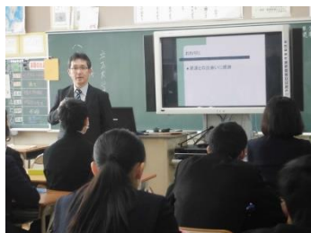
校長の授業のようす

これまでの3年生の頑張りに感謝しつつ、これからの人生の活躍を期待したいと思います。