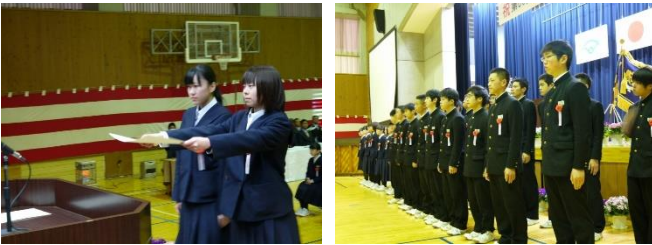
写真は昨年度の卒業式の様子で