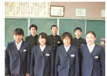
皆勤賞受賞の3年生