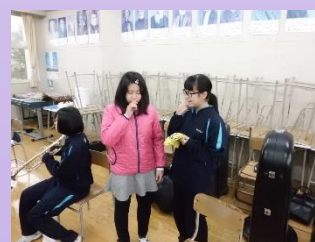
第2回部活動体験の様子