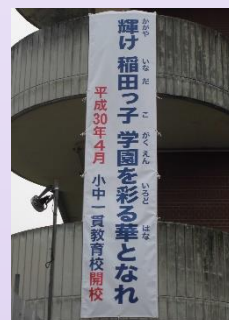
校舎東側に掲示された小中一貫スローガンの垂れ幕