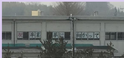
小学校に掲示されたお祝いのメッセージ