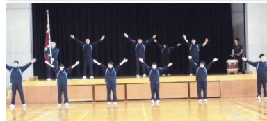
がんばっている 稲田中応援団