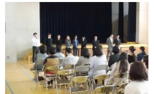
総会で新役員あいさつ