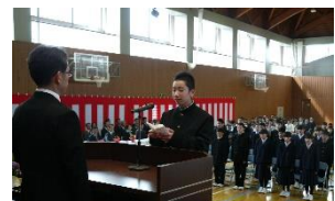
新入生代表誓いの言葉

校長式辞や来賓祝辞で述べられたように、3年間の中学校生活の中で、自分の目標を立てて、精一杯努力して大きく成長してほしいと思います。