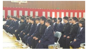
真剣に話を聞く新入生