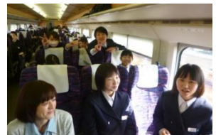
往きの新幹線の中

今後は、この成果を稲中生としての自信と誇りにして、様々な場面で最上級生の力を発揮して欲しいと思います。