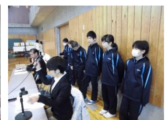
ボランティアの生徒たち