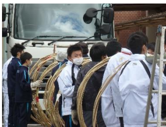
タガを並べて製作開始

これからも地域の行事に積極的に参加して、地域の方々から愛される学校づくりをして参りたいと思います。