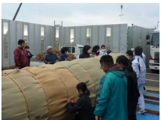
畳表を巻いてほぼ完成