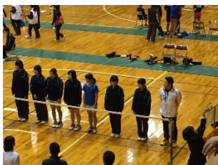
試合前のあいさつ

団体戦・個人戦ともに全国有数の強豪校の富岡一中と対戦しましたが、やはり力の差があり、負けてしまいました。しかし出場した生徒は「全国レベルのチームと対戦できて良かった」「試合が楽しかった」と前向きな感想を述べていました。この経験を次に生かしてほしいと思っております。