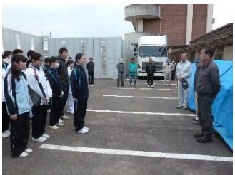
お礼の言葉を述べる代表生徒