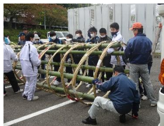
骨組みが出来上がる