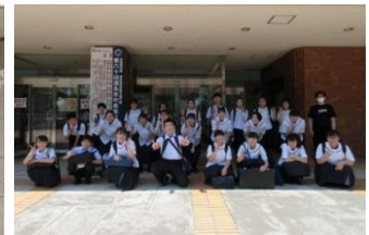
吹奏楽部の皆さん