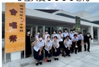
特設合唱部の皆さん