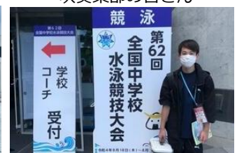
全中に出場した ●●●●さん