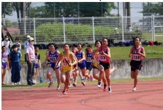
中体連支部陸上大会 (5/18)