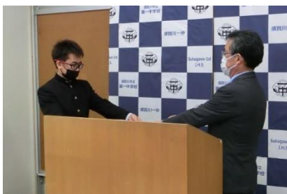
代表の●●●●さんの任命