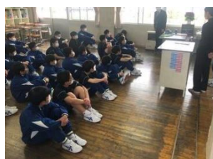
大人数が入った卓球部

中学生にとって部活動は心身の成長に大きく寄与するものであり、中学校生活の中でも大きなウェイトを占めるものであります。1年生は慣れるまで大変ですが、がんばってほしいと思います。