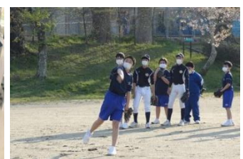
念願叶った野球部