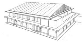
新体育館イメージ図

なお、市当局の話では、完成予定は令和5年3月で、新3年生の卒業式は「秀麗体育館」で行えるようにしたいとのことです。