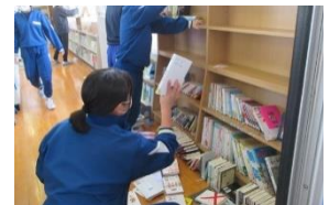
図書室の後片付け

3月15日に発行した学校だよりでもお伝えしておりますが、11年前の東日本大震災や、近年、比較的大きな地震などが発生しており、万が一に備えて防災意識を高める必要があります。今後、様々な機会をとらえて、防災教育を行ってまいりたいと思っております。