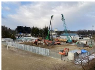
大きなクレーンが登場(2/3)