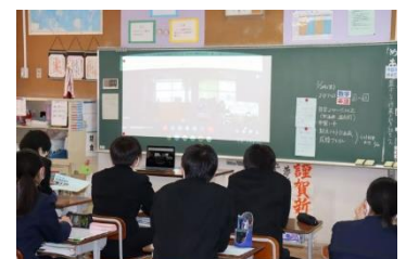
各教室でしっかりと聞く生徒