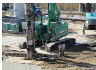
掘削機で抜いています(2/18)