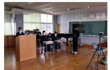
リモートによる総会

今回のリモートによる後期生徒会総会では、一堂に会して話し合うことができないという困難を克服して有意義な話し合いができました。これまでの3年生が受け継いできた須賀川一中の自治や秀麗の伝統をしっかりと受け継ぐことができ、来年度からの生徒会活動に期待がもてるのではないかと思います。