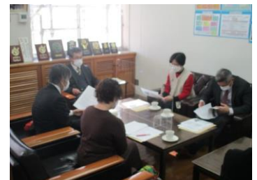
学校評議員との話し合い

当日話し合われた内容やいただいたご意見を今後の学校運営に生かしてまいりたいと思います。