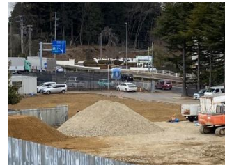
プールも解体されました(2/28)