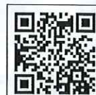
日野外気導入モード