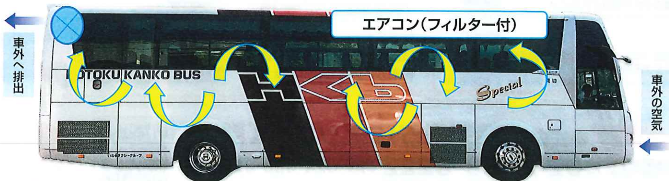
貸切バス 車内空調イメージ図