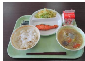
給食開始当時献立