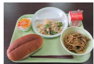
福島県「浪江焼きそば」