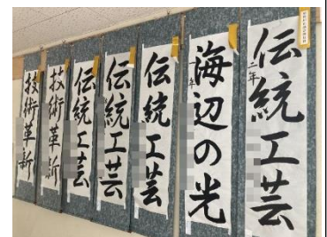
校内に展示された作品

2月3日(水)は「立春」。例年ならば2月4日が「立春」で、その前日2月3日が「節分」ですが、今年は2月2日(火)が「節分」です。例年より1日早い節分は、1897年以来124年ぶりのことだそうです。ところで暦の上では春になり、陽気も次第に暖かくなっていくことなのでしょう。毎朝正門で登校指導をしていますが、肌で季節の移り具合を感じています。やはり寒い冬は「おはようございます」の生徒の声も小さい時もあり、そんな時は私は意図的にいつもより大きな声で「おはようございます！」と声をかけています。今年度も残りわずかですが、だんだんと暖かくなっていくので、元気にあいさつをし、1日のスタートを切って充実した学校生活を送り、卒業・進級してほしいと思う今日この頃です。