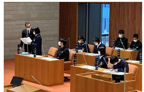
中学生による模擬議会 前列左から ●●●さん、●●●さん、●●●さん

今後、この経験を生かして、須賀川市の施策やまちづくりに関心をもつとともに、郷土愛を育ててほしいと思います。