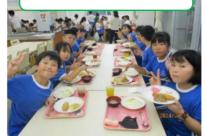
自然の家のおいしいご飯

出発する時、子どもたちに「全員が心から楽しめる宿泊学習にしよう」というお話をしました。子どもたちはその通り、お互いを思いやり、助け合いながら活動することができていました。学校に戻ったときの子どもたちの満足そうな笑顔が、充実した2日間だったことを物語っていました。子どもたちは、普段の学校生活では味わうことのできない「自分自身の本物の経験」を通して、また一回り大きく成長することができたと思います。ご家庭の皆様方のご支援・ご協力ありがとうございました。