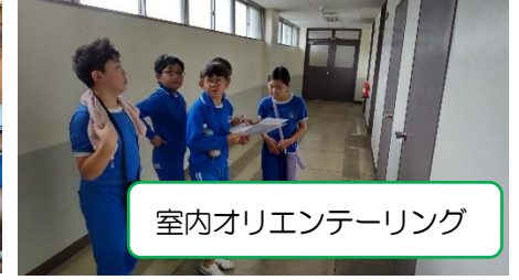
室内オリエンテーリング