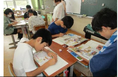
真剣に学習に取り組む子どもたち。真剣な姿は、いつもかっこいいです。

年より少し長いお休みとなっています。子どもたちには、長い休みだからこそできることにぜひ取り組むとともに、家族の一員として自覚をもって生活してほしいと思います。また、何より事故なく安全な楽しいお休みとなりますよう、ご家庭でのご指導をよろしくお願い申し上げます。