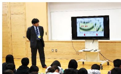
須賀川法人会の方の話を聞く

社会科で「私たちの生活と政治」について学んでいる6年生ですが、その中で「税金」についても学んでいきます。