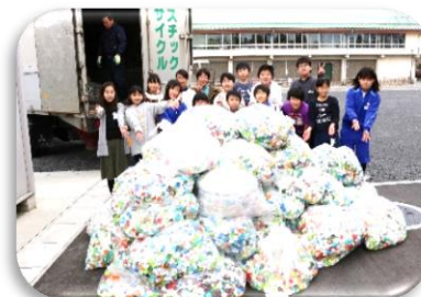
二小で集まったキャップを前

この運動は、発展途上国の子どもを救うために「ワクチン」を送る運動として行われています。二小で集まった361.5kgのペットボトルキャップは、ポリオワクチンにして約180本分に相当する量のようなのです。