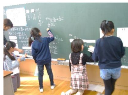
自分の考えを書く(3年2組・算数)

年末年始を迎えると、お年玉やお小遣いをいただく機会が増えます。この時期だからこそ、お金の価値や使い方を考えるよい機会です。