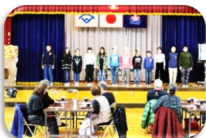
工夫した発表を行う6年生

12月7日、知る古会の皆さんを招いて成果を発表しました。6年生は、知る古会の皆さんのご協力を得て2回の校外学習を行い、須賀川の歴史を調べてきました。その成果をニュース番組やクイズ番組風にまとめるなど工夫して発表しました。知る古会の皆さんからは、6年生の発表に感動し涙したなど、お褒めの言葉をたくさんいただきました。6年生の成長を感じる発表でした。