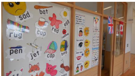
3階に「外国語室」をつくりました。