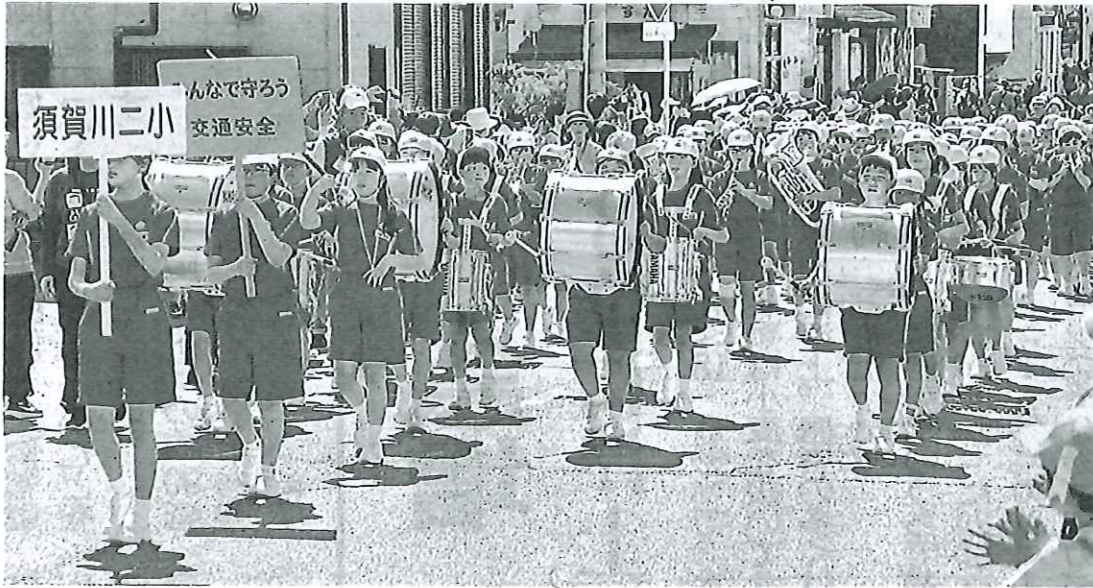
交通安全を願い行進する児童

5月27日朝刊の福島民報には、下記のとおり、本校鼓笛隊が大きく写真掲載されましたので、ご紹介いたします。