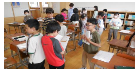
3年生だってけっこうレベルが高い。

授業を眺めると、“Almost English”（ほぼオールイングリッシュ）で授業を進めています。それをほぼ理解して反応できている子どもたちもすごい。3年生の授業では“How many ( )s ?”のフレーズを使って、20までの数を英語で答えています。