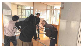
【取り押さえられる不審者(役)】