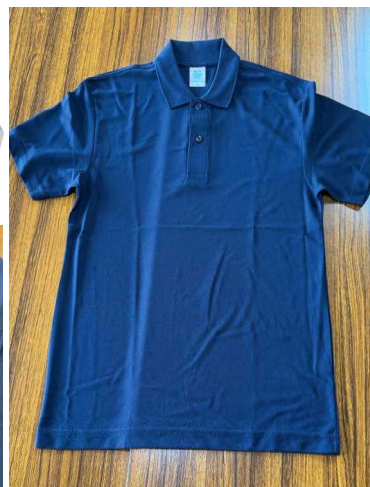
【R7年度～新しく加わるポロシャツ】

子どもたちが安心して夏の暑さから身を守り、学習や諸活動に取り組み、目標実現に向かって力強く元気に生活できるよう今後ともご理解とご協力をお願いいたします。