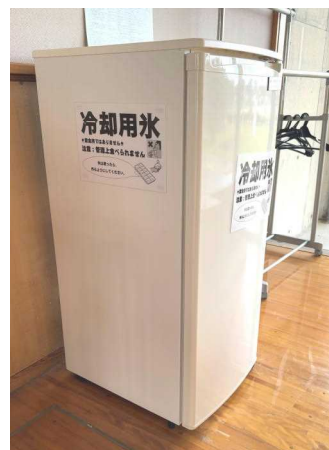
【明石会様から寄贈いただいた保冷器】