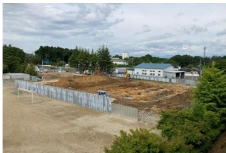
基礎部分の掘削工事 (6月16日)