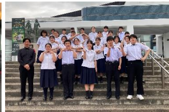
演奏後に記念撮影