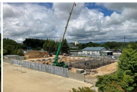
北側部分の型枠工事 (7月8日)