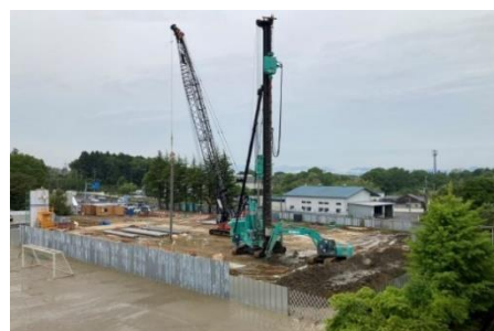
大型重機による杭打ち (5月16日)