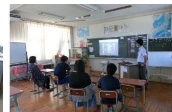
3年 5組 「国語」