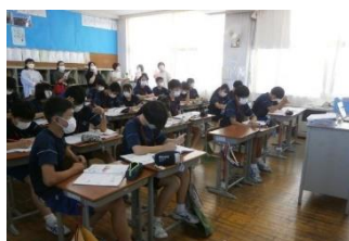
3年 3組 「英語」