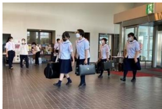
緊張しながら会場入り

なお、県大会は7月29日(金)喜多方市の「喜多方プラザ文化センター」で行われます。