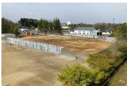
建設予定地に地縄 (4月21日)